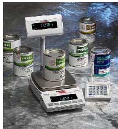
XB 6200D XB 3200D