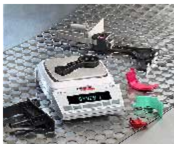
XB 4200C XB 320C