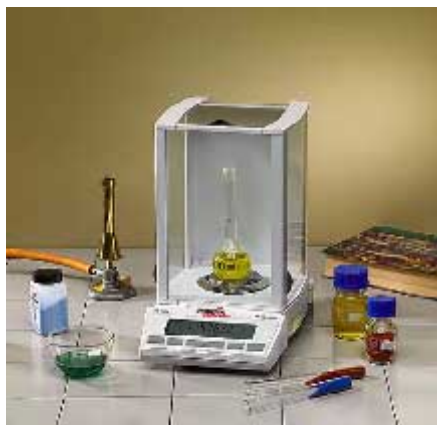
XB 120A XB 220A