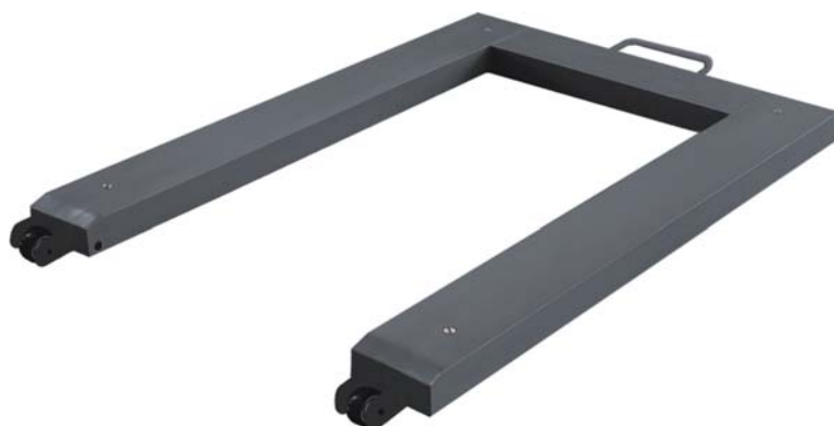
Version Acier (R4 F PP)