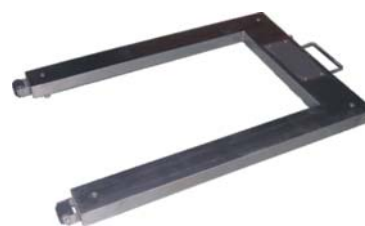
Version Inox (R4 FS PP-S)