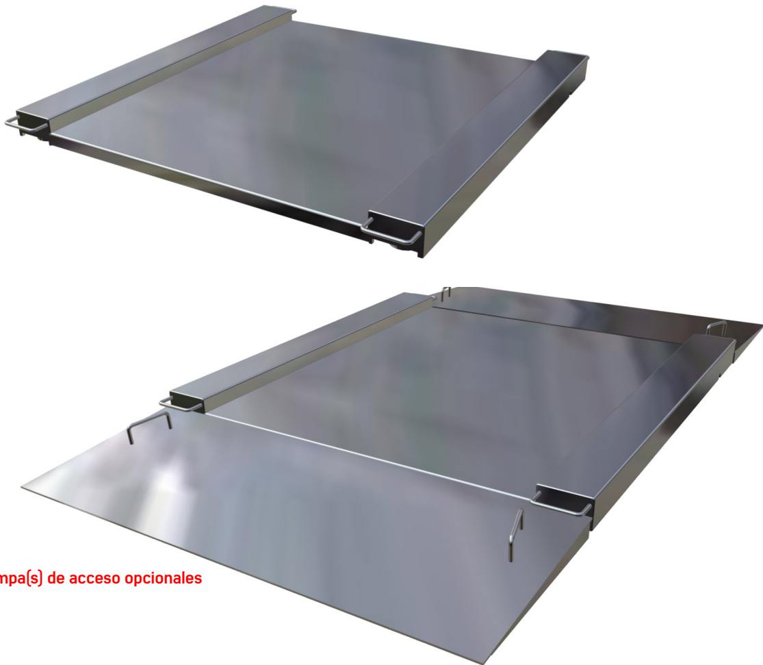
Rampa(s) de acceso opcionales